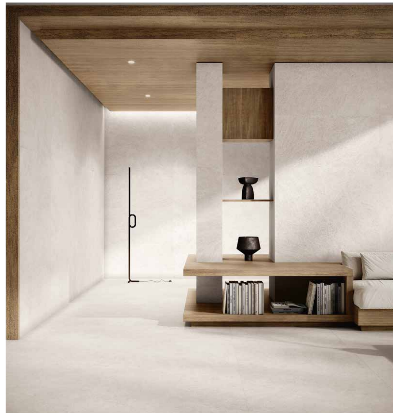
Alejandria White 60x120 White 100x100