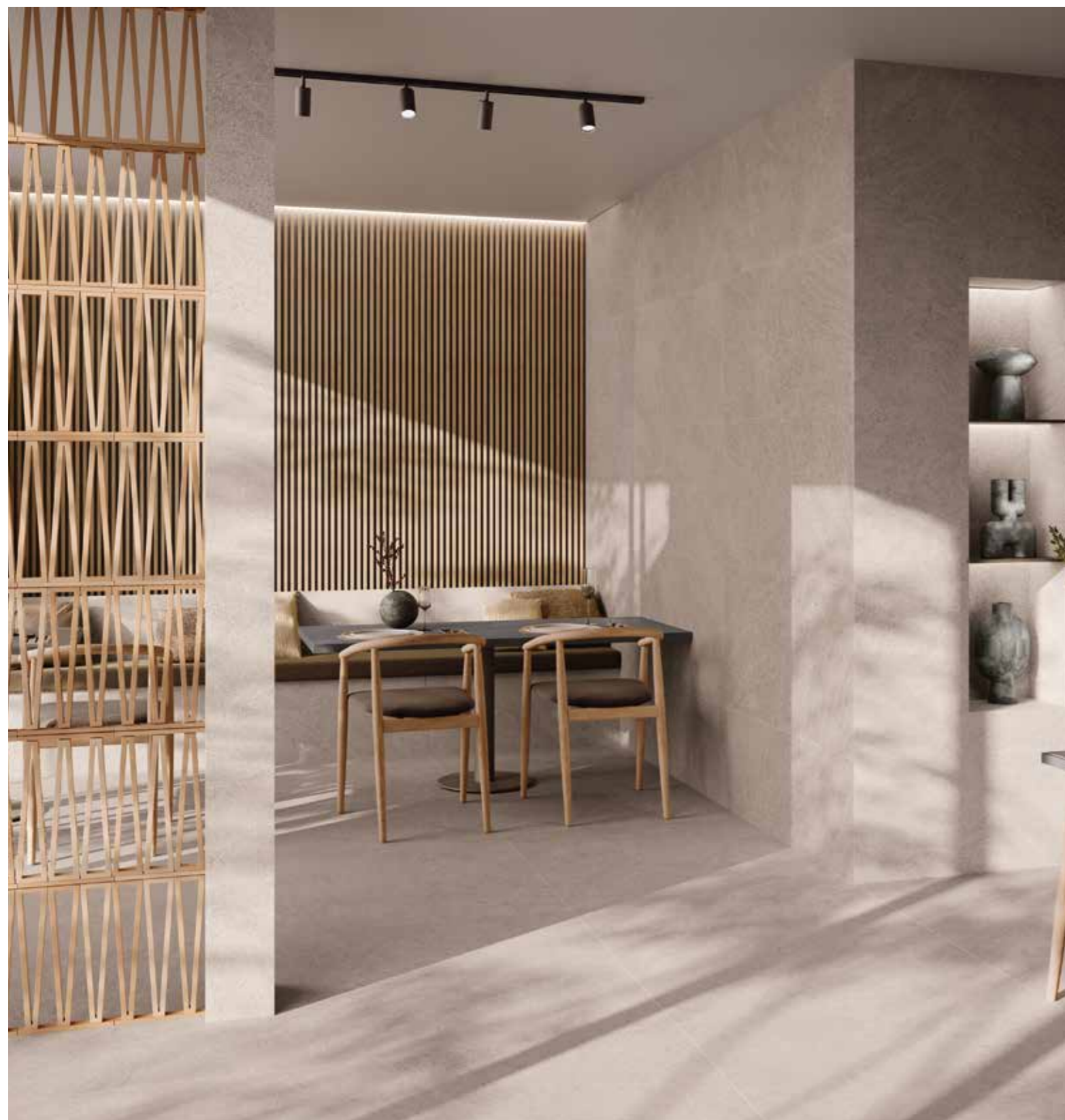
Alejandria Calcita 60x120 Calcita 100x100