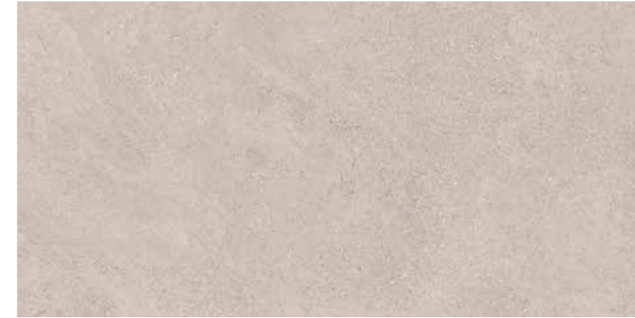
Calcita 60x120 cm.