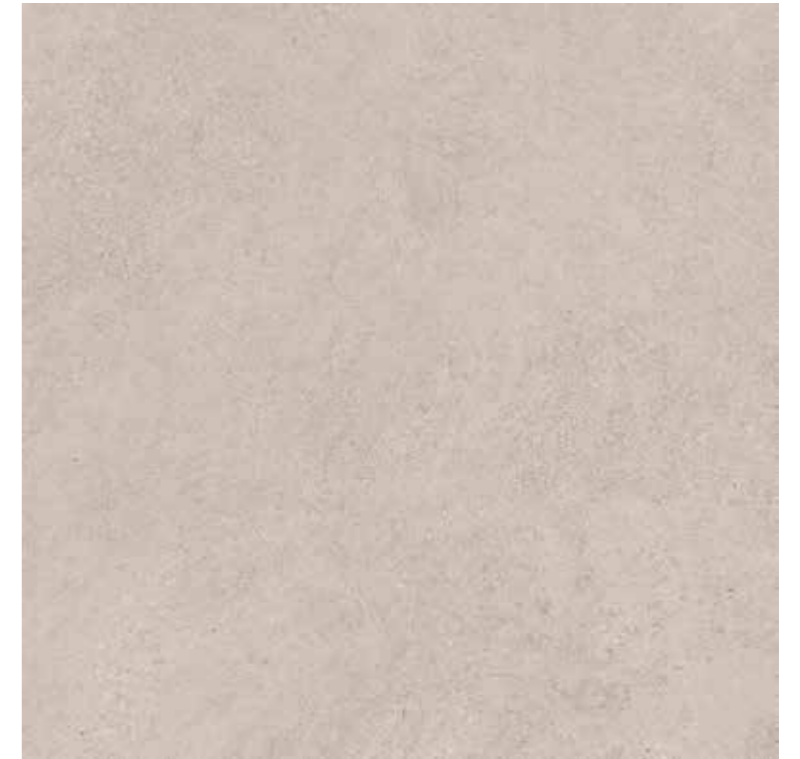
Cream 100x100 cm.