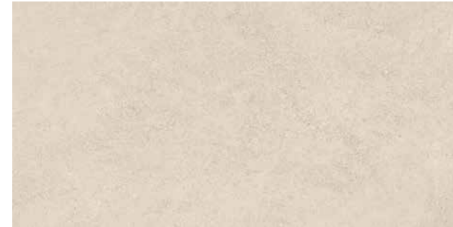
Cream 60x120 cm.