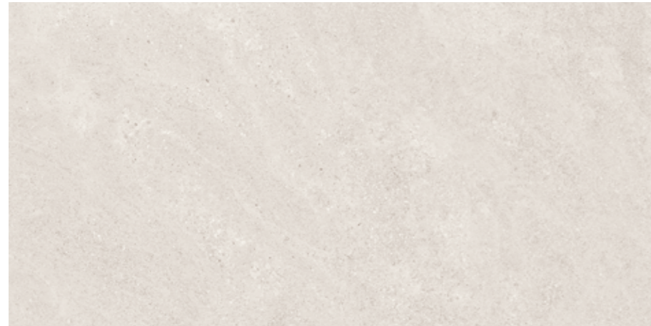
White 60x120 cm.