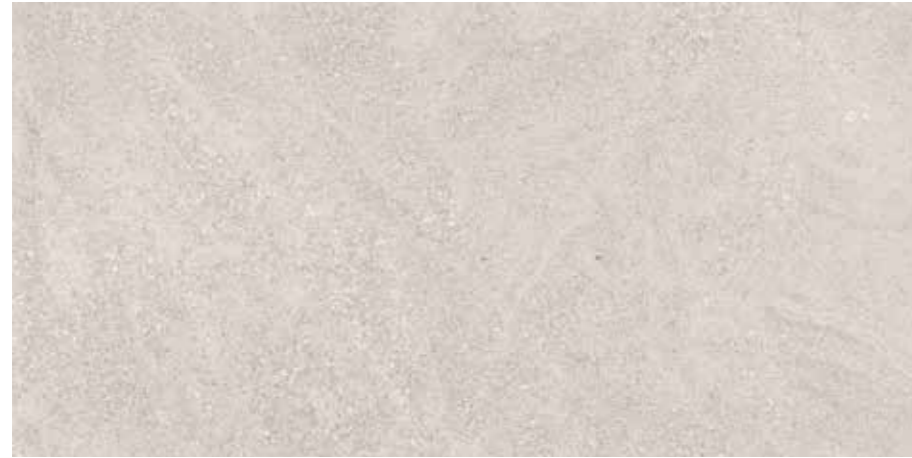
Pearl 60x120 cm.