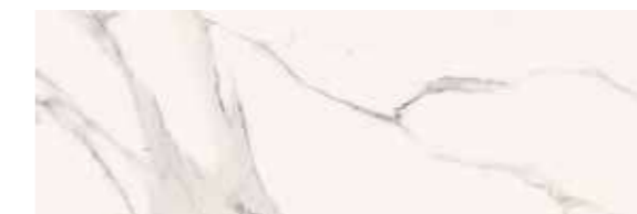
Blanco 30x90 cm. Rect.